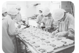
ふれあい給食 （国府支所の調理室）