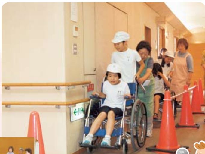
車椅子体験のようす

平成22年6月28日、大磯小学校4年生が、福祉について学ぶため町立福祉センター「さざれ石」に、施設見学と車椅子体験に訪れました。この体験では身体障害者介助ボランティアの方から乗っている人が安心できるような声のかけ方などをアドバイスしてもらい、「乗る人の気持ち」「介助する人の気持ち」を理解しようとして一人ひとりが真剣に取り組んでいました。