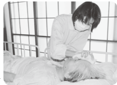
ヘルパーの活動の様子