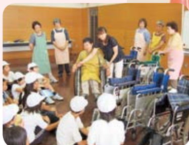
ボランティアの説明を聞く児童