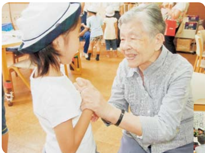
幼稚園児から歌のプレゼント ♪さよなら～あんころもち～またきなこ～ぼん♪