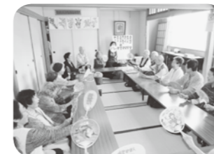
「あの頃は！はっ！」大きな口で口腔ケア 国府ミニデイサービスにて