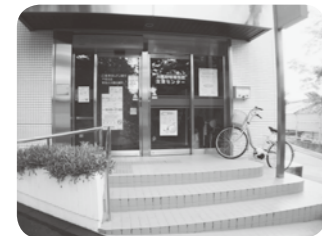
地域包括支援センター入り口