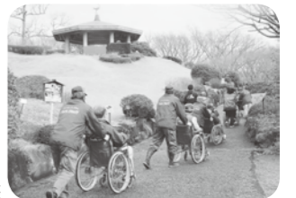
城山公園での介護講座

一緒に体験してみませんか 介護講座・車椅子の使用法講座などを 受け付けています。 お気軽にお問い合わせください。 ☎61-9390