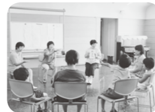
夏休み親子手話教室の様子