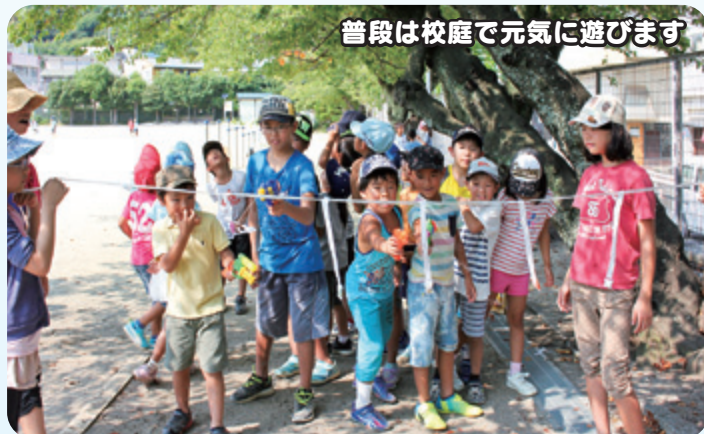
普段は校庭で元気に遊びます