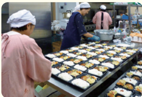
協力員さんによる手作り弁当です。