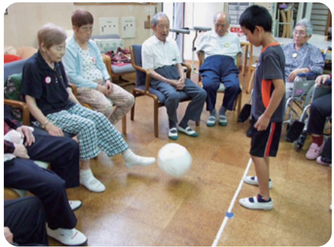
▲レクリエーションのお手伝い