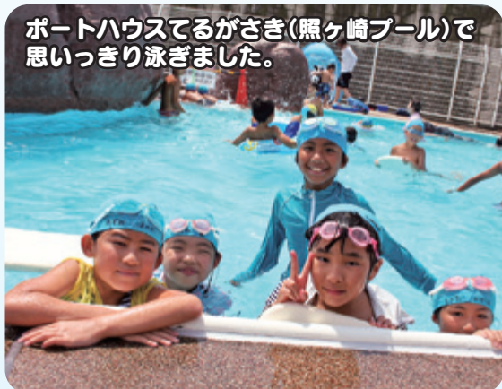
ポートハウスてるがさき(照ヶ崎プール)で思いっきり泳ぎました。

大磯学童保育所では、1年生から6年生までの児童が学年の枠を越えた交流の中で、ドッジボールやサッカー、手芸、ゲーム、かるた会等々、季節ごとの遊びや伝統的な遊びを楽しみながら、さまざまなことを学び、日々成長しています。