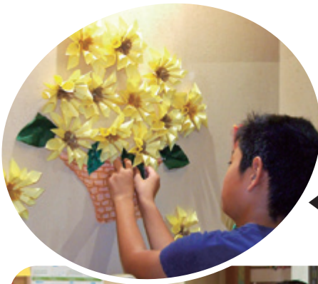
◀利用者さんの作品を壁に飾ります