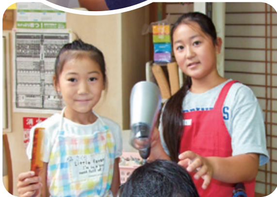
◀入浴後のドライヤーかけ

大磯町社協、デイサービス事業「大磯ケアセンターさざれ石」で開催しました。 今年には多くの小学生が参加され、福祉について学びました。