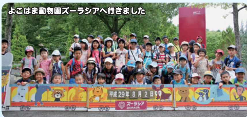
よこはま動物園ズーラシアへ行きました